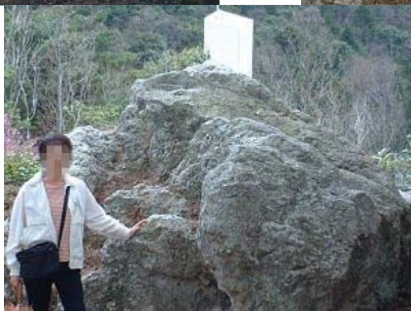
温泉神社の裏手にある愛宕山を登ったところにある天狗岩。