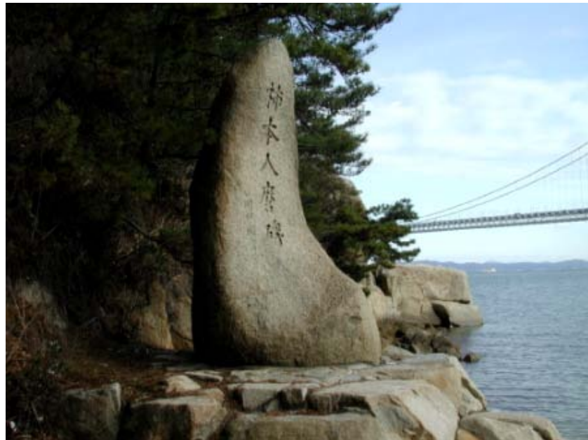
写真01→柿本人麿碑。背後に見える大岩は人麿岩と呼ばれています。