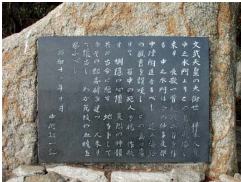
写真02→碑に埋め込まれた碑文です。