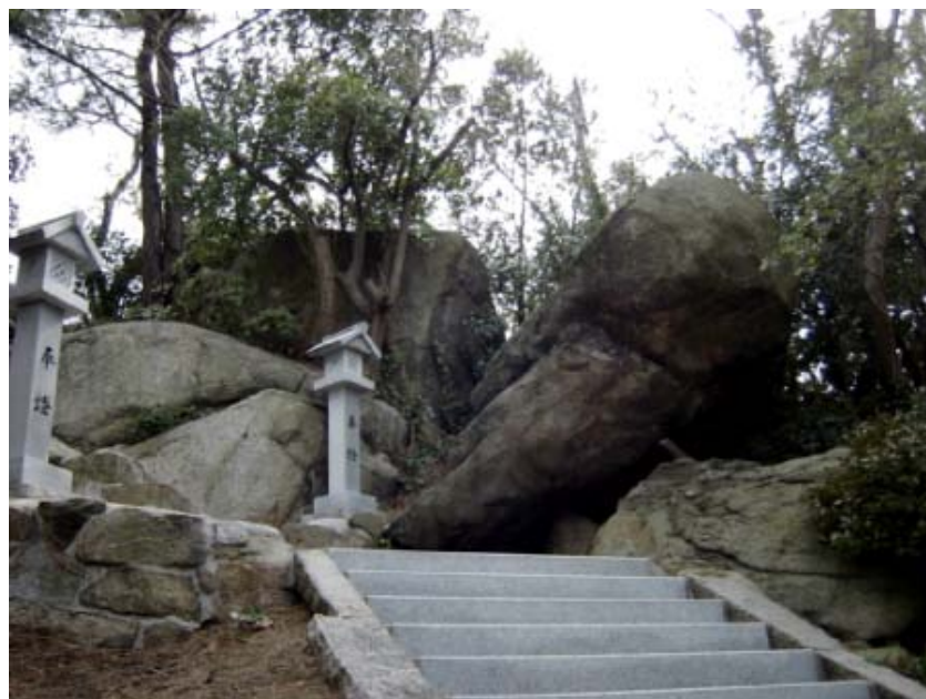
写真14→島の氏神社（金比羅社）でみた大岩です。