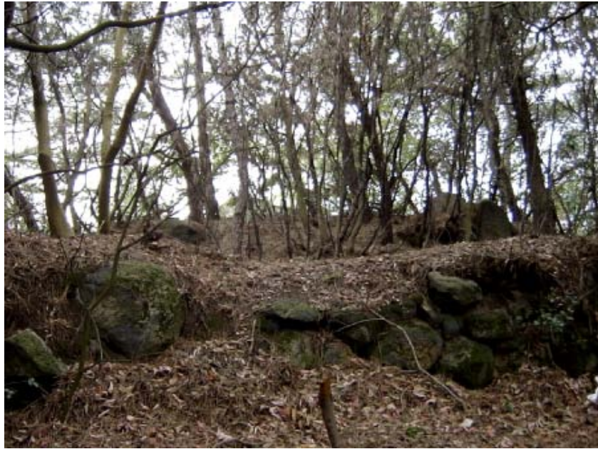
写真12→丘は全体として三段構造です。