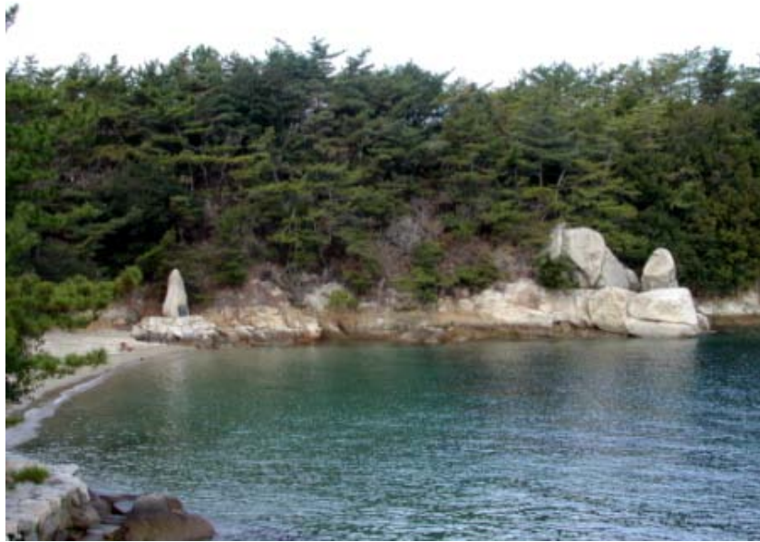
写真04→岩の大きさを見て下さい。左に見える人麿碑が高さ2メートルくらいです。