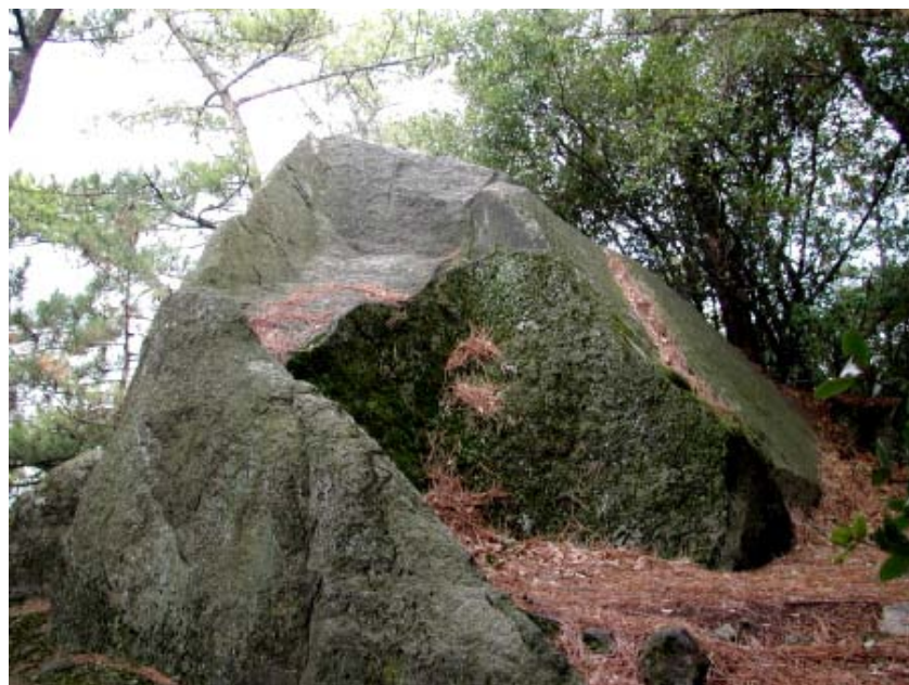
写真10→岩を別の角度から撮ってみました。