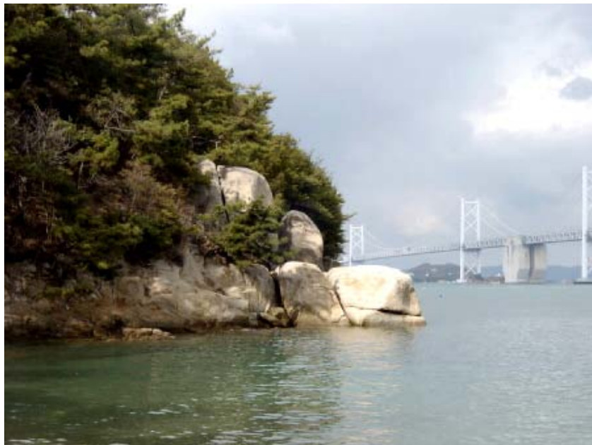
写真05→人麿岩と瀬戸大橋。（沙弥島は、瀬戸大橋の絶好のビューポイントでもあります。）