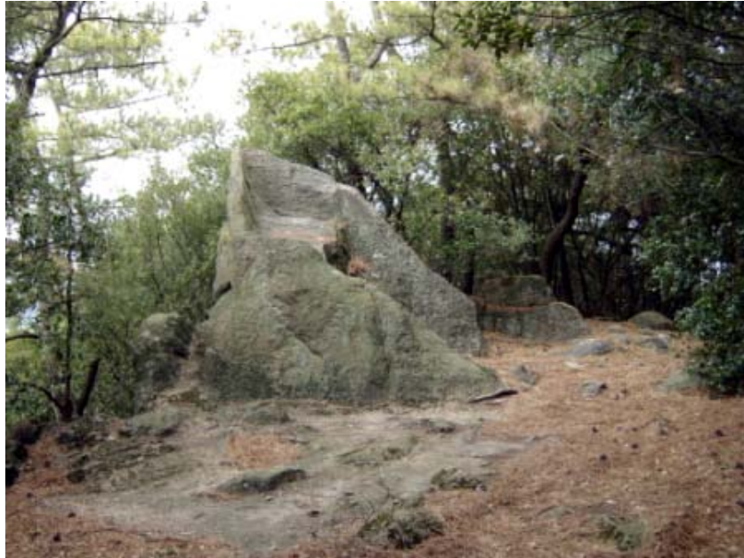
写真08→遊歩道から丘を登っていくと、例の岩があります。