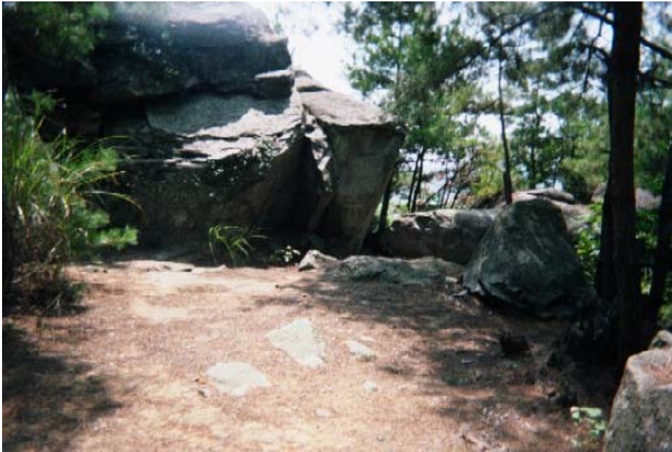
イメージ03→奥宮の御神体巨石；磐座