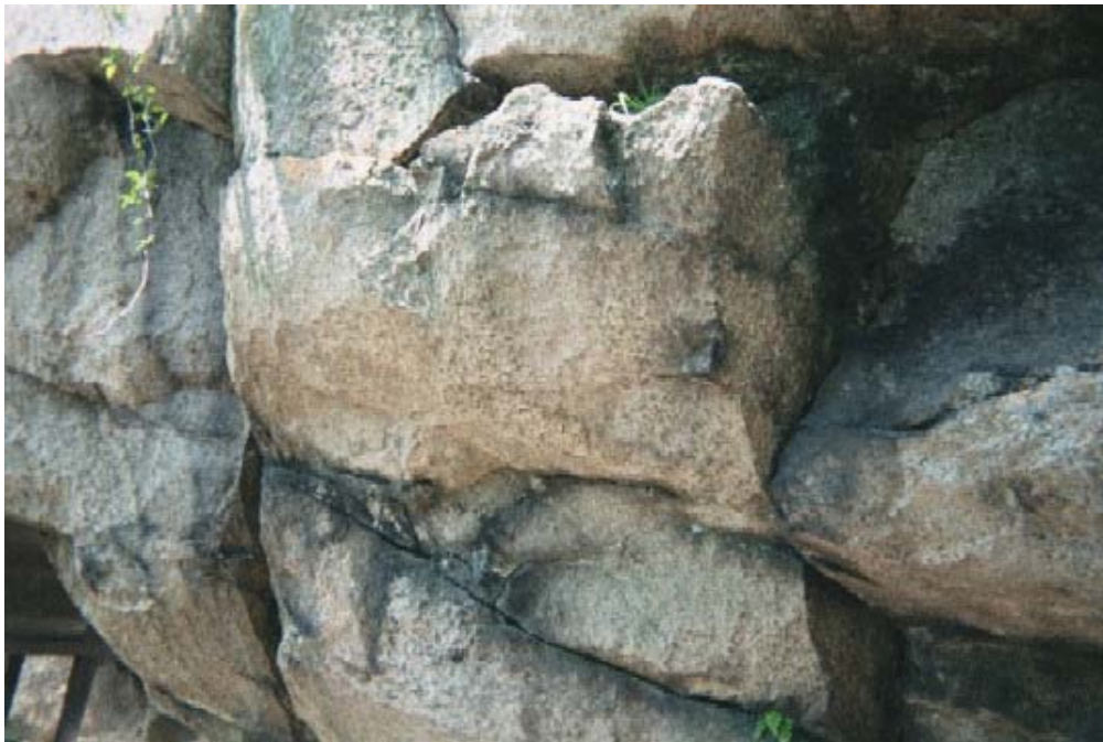
イメージ10→六甲越木岩神社の甑岩を彷彿させる御神体