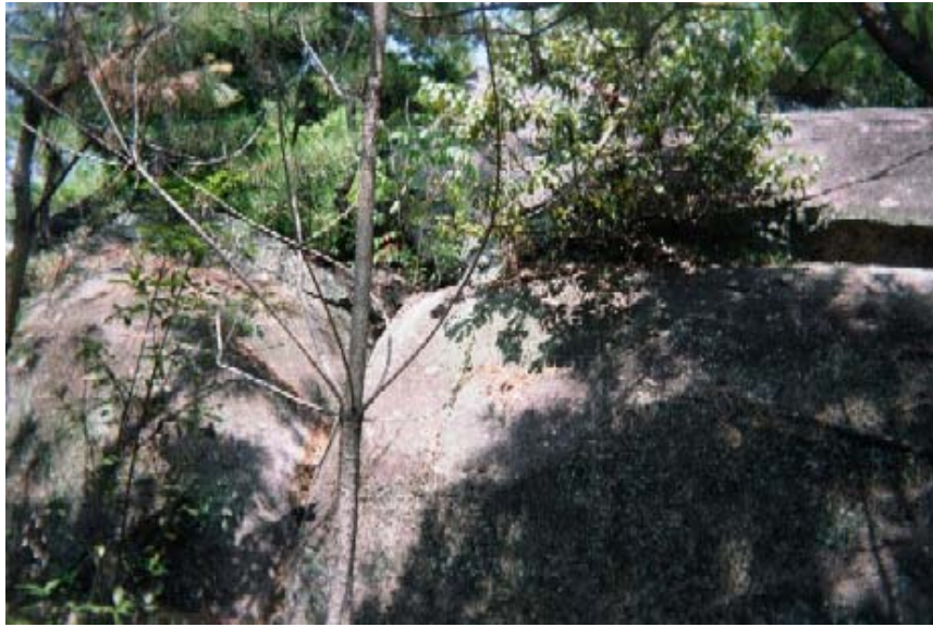
イメージ05→頂上付近の巨石