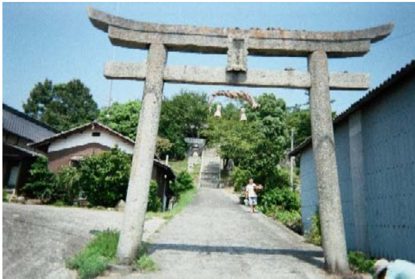
イメージ01→磐岩神社正面鳥居