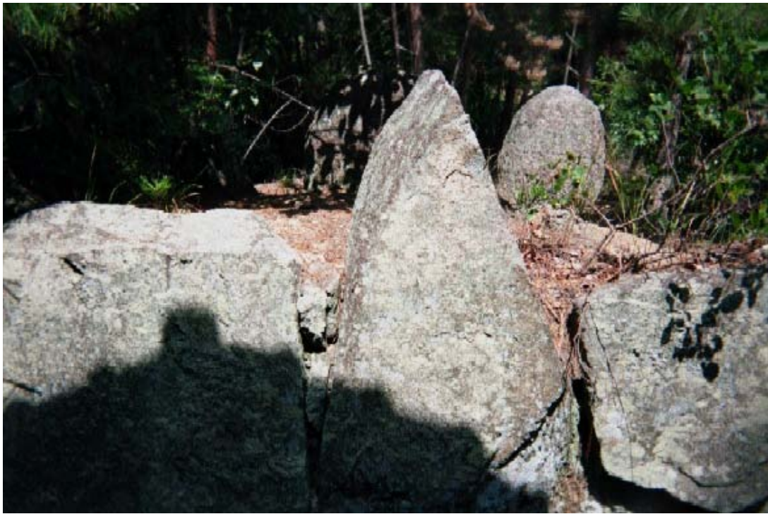
イメージ07→剣岩；男根岩