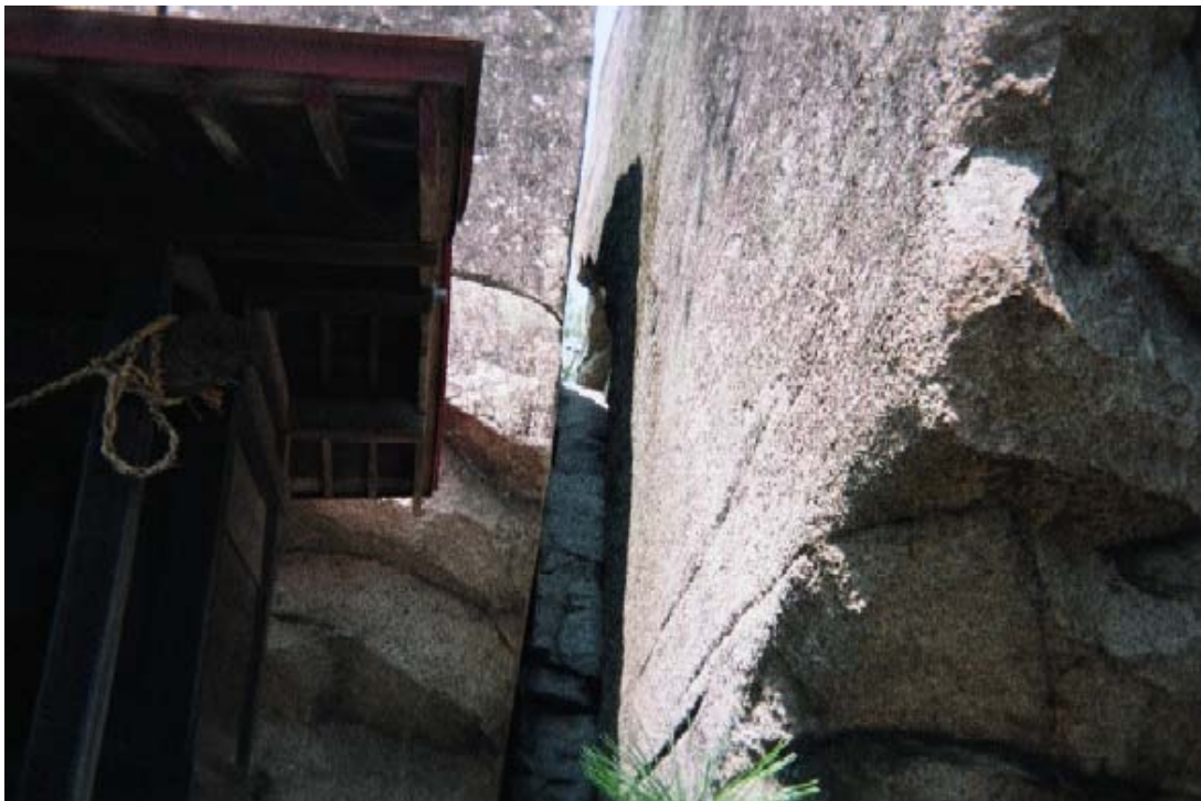
イメージ08→御神体巨石の人工加工？を思わせる間隙