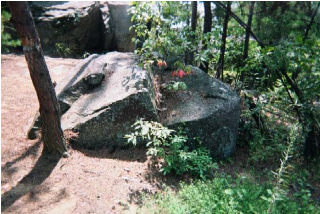
イメージ04→周辺の階段状巨石

---photo(C)-2004-by-Murakami Tarou @ Kanagawa