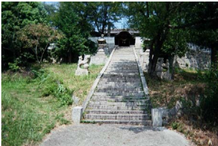
イメージ02→磐岩神社社殿