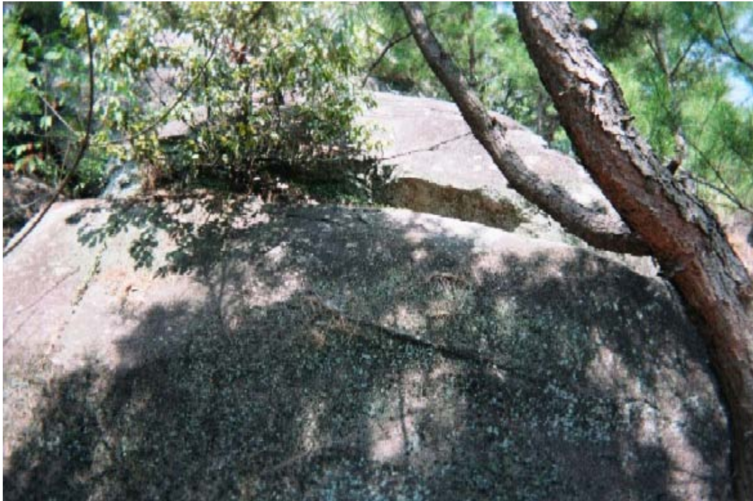
イメージ09→御神体巨石上部の球状部