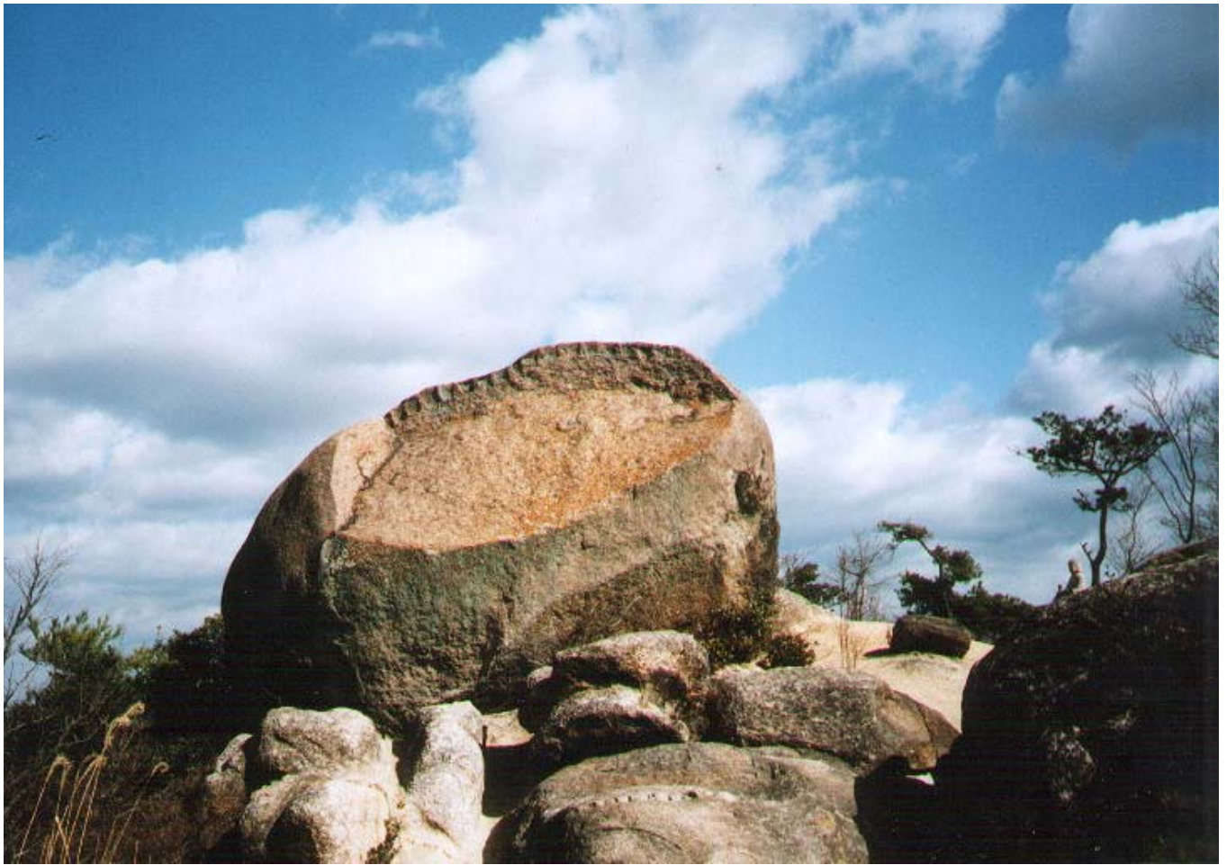
イメージ07→甲山麓の磐座